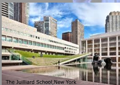
The Juilliard School, New York